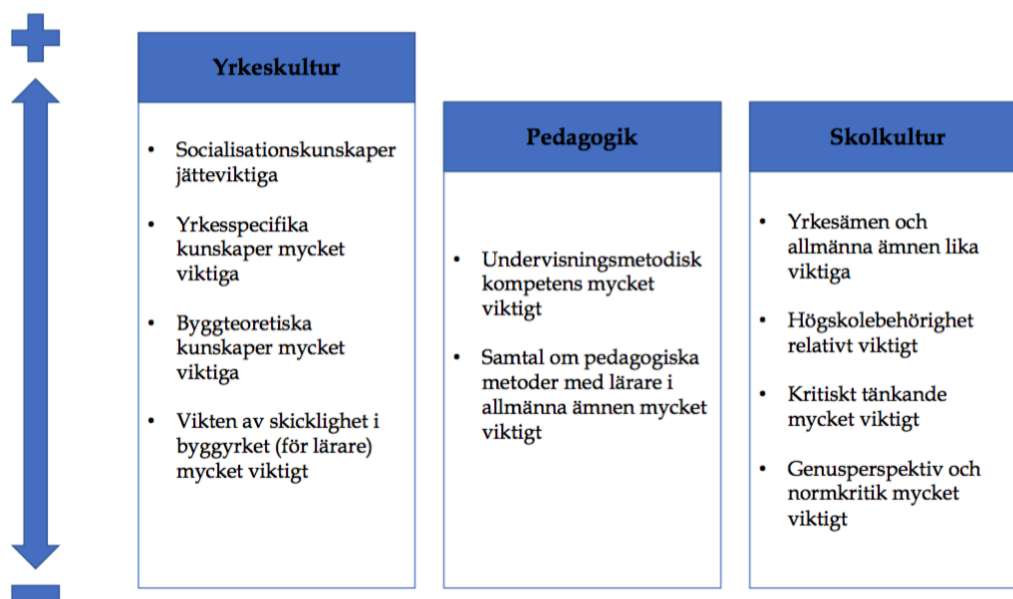
Figur 1. Idealtyp "lärare": vad är viktig kunskap?

Som illustreras av Figur 1 värderar yrkeslärare som identifierar sig som i huvudsak lärare dessa tre fält som varande av liknande och dessutom av stor vikt, även om yrkeskultur kan tolkas som något viktigare än de andra två. I en jämförelse med yrkeslärare som identifierar sig som i huvudsak hantverkare framträder här relativt tydliga skillnader.